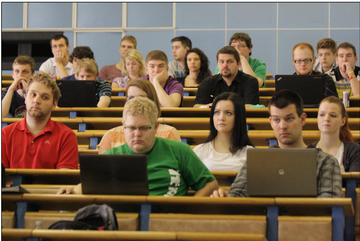
Publikum vedecko-technickej konferencie