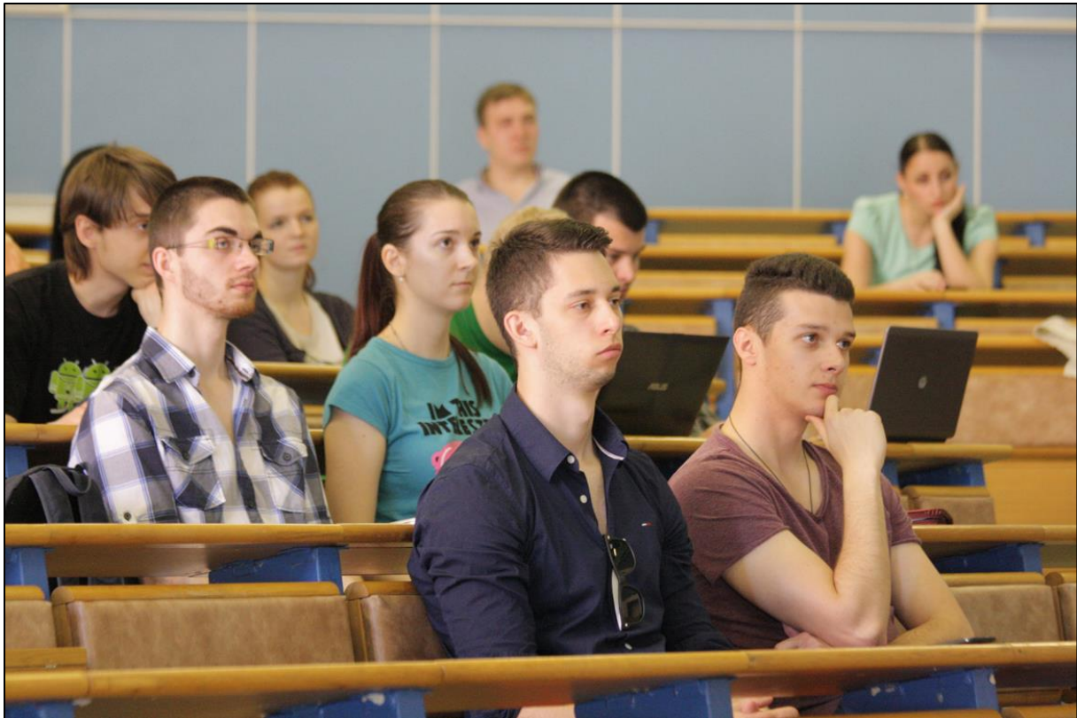
Publikum vedecko-technickej konferencie